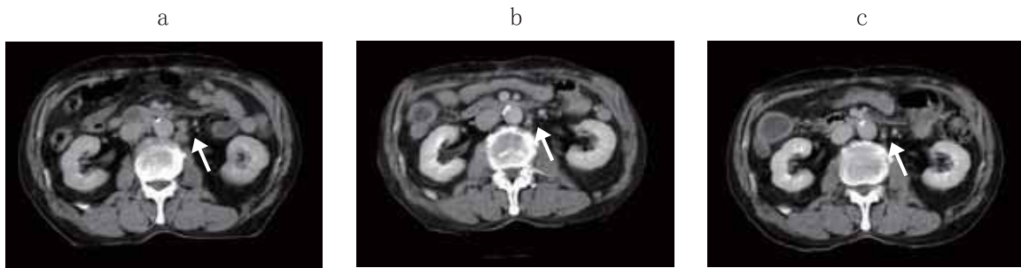
図2 腹部リンパ節腫大の推移